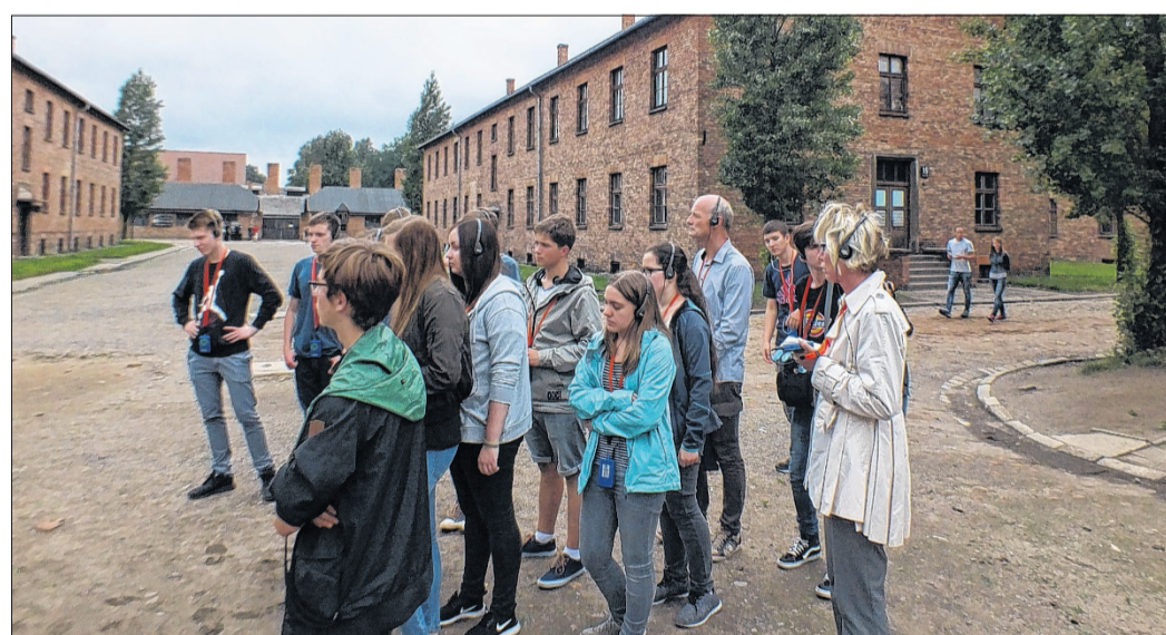
Unsere Schülergruppe vor dem Block 16 des Konzentrationslagers.