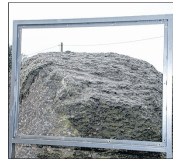
Die leere Infotafel vor dem Schwarzen Riesen.

Der Gesteinsgartenverein hat die Beschädigung zur Anzeige bei der Polizei gebracht. Der Sachschaden beläuft sich auf mehrere hundert Euro.